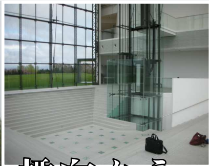
写真大=モエレ沼公園のガラスのピラミッドから見た桜、写真小=ガラスのピラミッドの内部