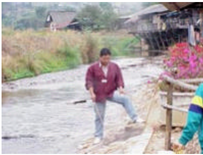
温泉タマゴを作るガイド

商売になるのだろう、この業者は交配を行い良個体を作っている、4媒体の大きな花も多く良い色の物は非常に高価で？万円するとか、趣味のある人は小型の株を求めていた。ちなみにこの店のオーナーはクライスラーにのっていた。