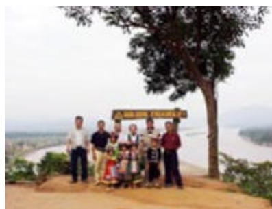
ゴールデン・トライアングル