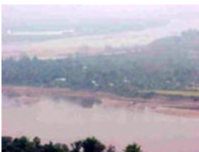
メコン側の向こうがラオス

国境町チェンセーンに向かう途中、遺跡 WAT PASAK を見学した。メコン川向こうにラオスを見渡せる高台に上り、ラオスを見下ろすと、小さな村々が見える程度でほとんどが森林に覆い尽くされている。タイとの交流は盛んで、夕方になると沢山の水牛が船で運ばれてくるらしい。タイ側の川沿いは商店がずらりと並びラオスの商品基地を感じさせる。