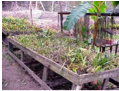
キーリーの山取株とキーリーの娘さん