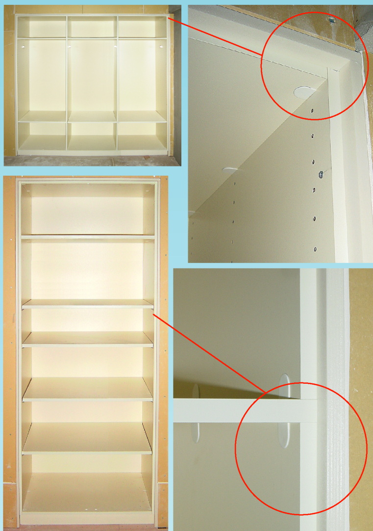
※上記施工写真は扉・クロス等、取付け前のものです。