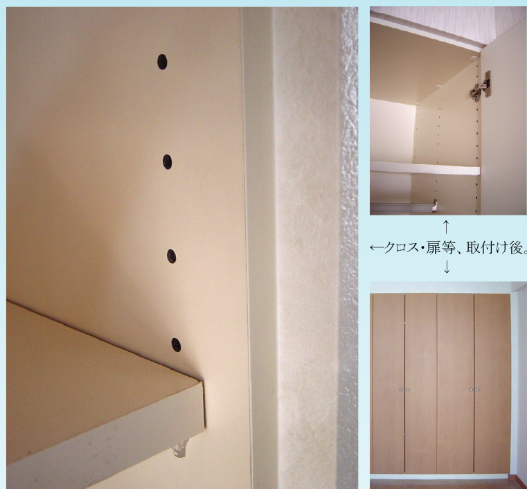
←クロス・扉等、取付け後。

軽くて丈夫な樹脂製です。 耐水性で、湿気によるソリが無く、切断も容易です。効率よく作業できるように考案された、収納用ボード受け枠材です。